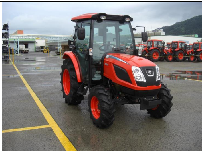
FIȘA TEHNICĂ Tractor Kioti, mod.” H ”:,„ NX6020H & NX6020CH ” cu motor Tier 4/Euro 4;